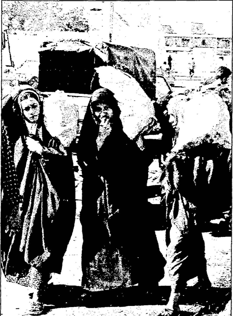
سيدات عراقيات في أحد أسواق بغداد

في الشهر الماضي من ان ريتش فاشم موقع سلاحها من دون التسليم مع السلطات. وقال المصدر ان فريق المفتشين الدولي الذي يرأسه امريكيون وخمسة بريطانيين وواحد روسي، وذلك لاعتباره غير متوازن في تركيبه. وقال المصدر ان فريق المفتشين الدولي الذي يرأسه امريكيون وخمسة بريطانيين وواحد روسي، وذلك لاعتباره غير متوازن في تركيبه.